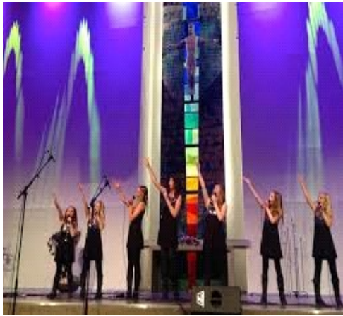
Detter er vår

visjon. Att mennesker på Bogafjell skal se hvem Jesus er, tro på Ham og leve ett liv som hans etterfølgere.